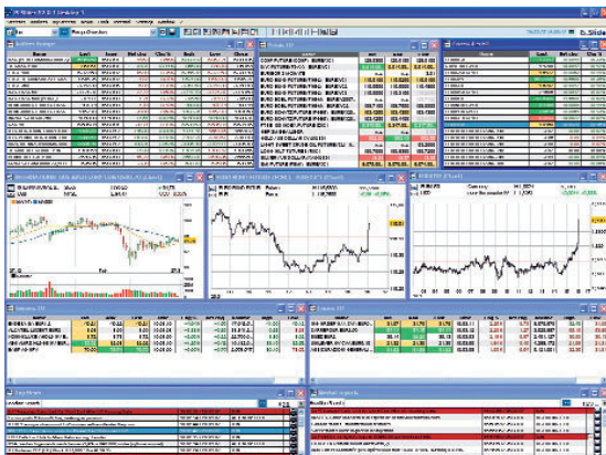
IS.Slider: Passgenau für anspruchsvolle Beratungs- und Vertriebsprozesse.

Der Trend zum maßgeschneiderten Terminal zeigt sich im Erfolg von IS.Slider. Das lokalisierbare, individualisierbare Finanzmarktterminal von Interactive Data Managed Solutions wurde Mitte 2003 eingeführt und wird derzeit von bereits mehreren tausend Anwendern in weltweit 14 Ländern genutzt. Die Einsatzbereiche gehen vom Berater vermögender Privatkunden, wie bei Bank Sarasin & Cie AG oder Rahn & Bodmer in der Schweiz, über das gehobene Retail- Segment von Sparkassen hin zu Investmentbanken und Beratern, die eine nahtlos integrierte Version von IS.Slider in den Informations- und Softwareangeboten von Capital IQ nutzen. Für die hohe Lokalisierbarkeit des Terminals sprechen auch die neuesten Einsatzgebiete Osteuropa und Naher Osten.